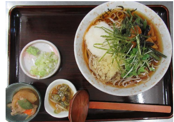
山菜・山かけそば