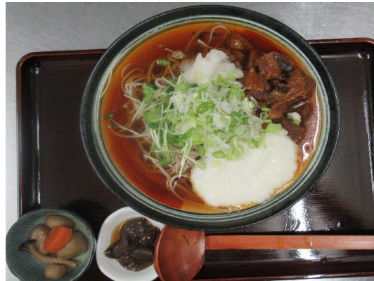
牛すじとろろそば