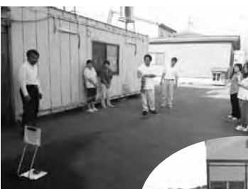
職員による消火訓練の様子

参加者は利用者18名、職員（世話人含む）12名で、「夕方、正面玄関の喫煙所より出火」という想定のもと、訓練を行いました。GHC Hの場合、夜間や土日など、そこが生活の場所であることから、他事業所と比べ、火災や地震などのリスクが高いため、日頃より防災に対する知識や意識をきちんと持つことが大事であることを再認識しました。