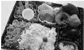
比内地鶏デラックス弁当

お惣菜のお求めはイオンスーパーセンター美郷店、または、もくもく道場でお買い求めできます。燻製のお求めは、道の駅仙南、道の駅協和、道の駅十文字、イーストモール等で購入することができます。