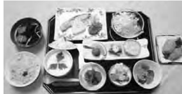
比内地鶏会席 1,000 円 (コーヒー、デザート付)