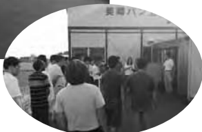
避難後、講評を頂いている様子