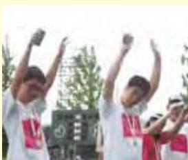
大健闘の選手のみなさん