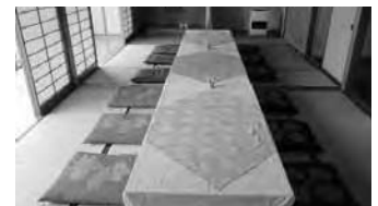
レストラン和室 (洋室もごさいます)