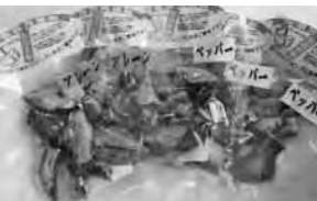
比内地鶏燻製 (全 5 種)