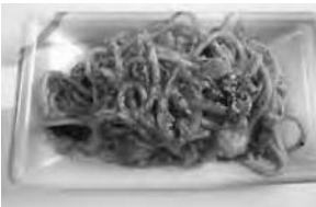
人気のナポリタン