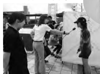
インタビューに答える晶さん。朝のニュースに登場しました!