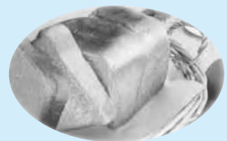
美郷パン工房 手づくりパン