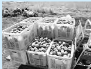
自家製野菜 (じゃがいも、にんじん、玉ねぎなど)