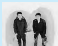
ウッディいのおか

2/15、生活訓練のみなでかまくら祭りの見学に行き、実際にミニかまくらを作らせてもらいました!穴をあけるのはなかなか難しいなあ…と苦戦しながらもみんなで協力してミニかまくら完成!!とても寒かったですがみんなの顔には笑顔がはじけていました。