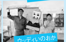
ウッディいのおか