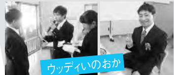
ウッディいのおか

各事業所で、成人を祝う会が行われました。法人全体で新成人を迎えた方は4名です。おめでとうございます。