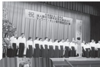
オープニングを飾る合唱団

合唱でオープニングを飾り式典が開会されました。企業様、ボランティアの方、全国大会で表彰や活躍された利用者さんの表彰が行われました。美郷町長様、横手市長様から祝辞をいただきました。