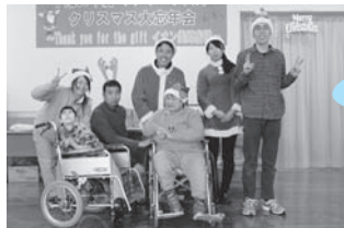
◀イオン美郷店様 12月17日(水)