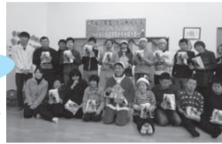
イオン美郷店様 ▶ 12月20日(土)