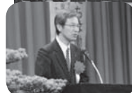
松田美郷町長より祝辞