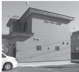
グループホーム横手

各ホーム 6 人定員で、個室となり、内 4 室はトイレ・バス付となっています。また、両ホームともスプリンクラーが設置されており、利用される方の安心・安全にも配慮されています。また、従来からありました『グループホームあけぼの』にも今回新たにスプリンクラーを整備しました。これからも、利用者の方の良好な住環境を整え、地域の中で利用者がいきいきと自立に向けた生活ができるようにサポートしていきます。