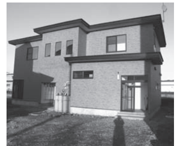
グループホーム作山Ⅱ