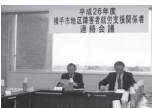
平成26年度 横手市地区障害者就労支援関係者 連絡会議

10月28日(火)横手市地区の障害者就労支援関係者連絡会議を開催しました。この地域で、障害者雇用を実施されている企業さんをはじめ、ハローワーク障害者職業センター福祉サービス事業所、特別支援学校の各関係者にお集まりいただき、障害者雇用の現状から、課題等意見交換を行いました。働く力だけではなく、生活面での課題についても触れられ、就労を継続するための生活支援も重要であることを改めて感じました。