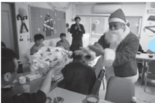
◀イオン大曲店様 12月20日(土)