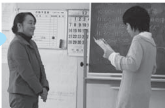
マックスバリュ東北様 ▶ 12月20日(土)