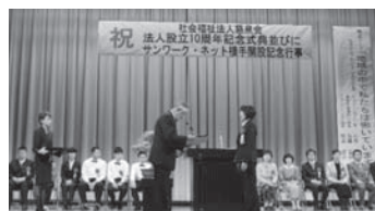
感謝状栄光賞の贈呈